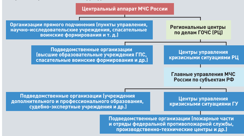
Рисунок 2. Организационная структура МЧС России

делить, по каким направлениям есть провалы, за счет применения научно-обоснованной системы показателей, своевременно информирующей о неэффективном и нерезультативном использовании бюджетных средств;